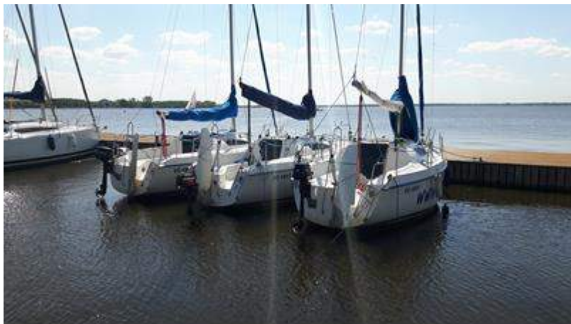
ANTILA 26 cc

Do Państwa dyspozycji mamy jachty kabinowe: ANTILA 26 cc, SASANKA 660, TANGO 780